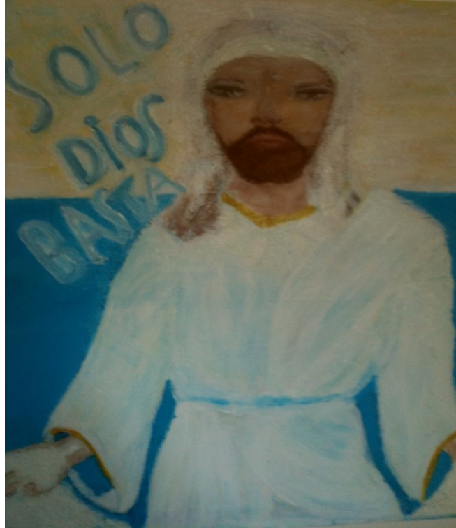
Tableau médiumnique réalisé à Paris en août 2005

Ouvrage collectif coordonné par le département doctrinal de l'ASITA